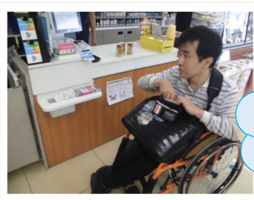
コンビニで買い物をされています

羽ばたきヘルパーステーションでは、利用者様の居宅での入浴/排泄介助/食事介助/通院介助等の身体介護や調理/洗濯/掃除/買い物代行などの家事援助を行います。その他必要に応じて健康や日常生活上の状況をお伺いし、生活上のご相談や助言も行っております。