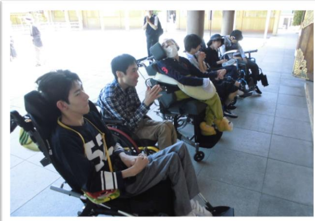
新しくきれいになった護国神社での参拝