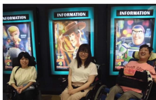
イオンシネマ新潟南「トイ・ストーリー4」観たいな

Mail : pia-kiyo@jn3.so-net.ne.jp URL : http://www016.upp.so-net.ne.jp/friendland/friendland.htm