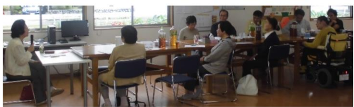
管理栄養士さんによる健康で長生きできる食事の話

☆9月21日には、ケアプランセンター主催の「健康福祉祭」を開催いたします。ぜひ、ご近所・お友達をお誘いお越しください♪