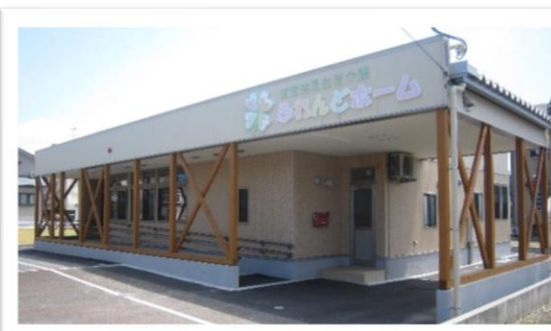
ふれんど・びあの敷地内の奥に併設されており、施設内は広々としたリビングを中心に生活しやすい間取りとなっています。定員4名

ふれんど・ホームでは、生活地域での日中活動をしながら、夜間は暮らしの場として少人数の共同生活の支援を行っており、入浴・食事・排泄の介助などの日常生活に必要なサービスを行っています。