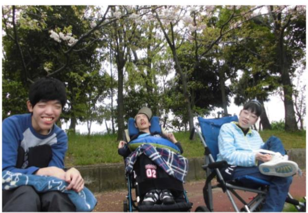
桜が満開の寺山公園で足を止めて記念撮影