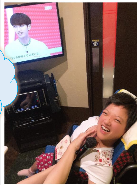
カラオケボックスで好きな歌をうたいます