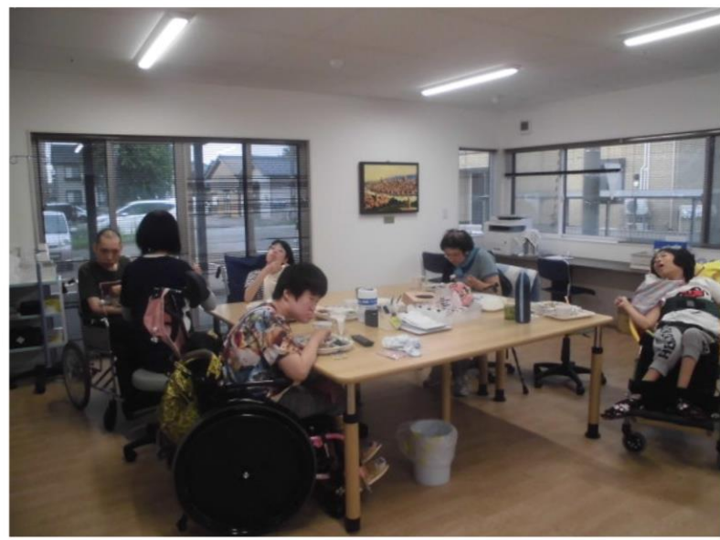
みんなで夕食をいただきます

ショートステイふれんどでは、自宅で介護を行っている方が様々な理由により介護を行うことが出来ない場合、一時的に施設に入所していただき、食事、排泄等の必要な支援を行います。このサービスは介護者にとってのレスパイトサービス（休息）としての役割も担っています。