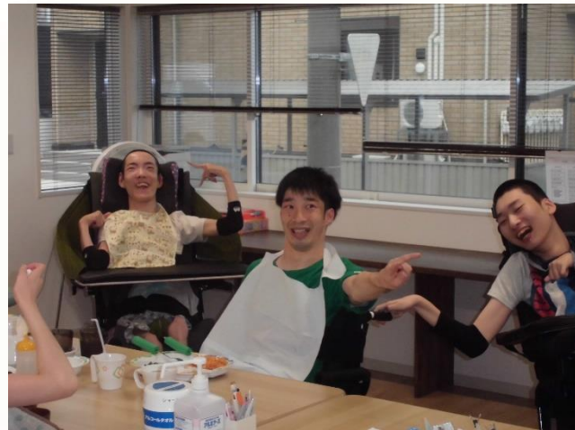
みんなで食事しながら楽しくおしゃべりします

ゆったりとした室内でご自分の時間を大事にしたい方も利用しやすいように完全個室と利用に不安がある方も安心して利用が出来る多床室があります。利用される際にご相談ください。