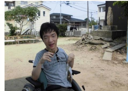
ケアホーム裏にある神社に行ってお昼をたべたりします

移動が困難な人に対してガイドヘルパーによって行われる地域生活支援事業です。写真は移動支援を利用して、外出を楽しむ様子です。