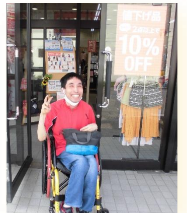
この日は衣料品店で お買いものをしました