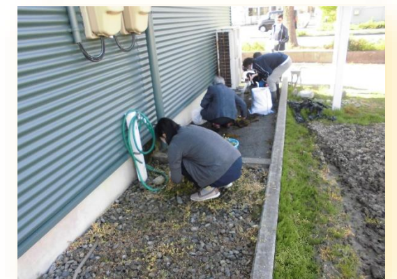
施設協の草むしり