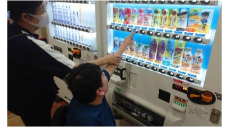
移動支援でお出かけ!! お買いものをしたり 楽しい時間を過ごされています

その他、移動支援や必要に応じて健康や日常生活上の状況をお伺いし、生活上のご相談や助言も行っております。