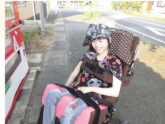
施設の近くにある自販機までお散歩 + ジュースを買いました