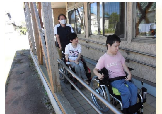
ふれんどホームでは5月12日に 避難訓練を行いました

ふれんど・ホームでは、生活地域での日中活動をしながら、夜間は暮らしの場として少人数の共同生活の支援を行っており、入浴・食事・排泄の介助などの日常生活に必要なサービスを行っています。