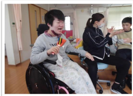
3/23(火)外部ボラ(遥研命様)