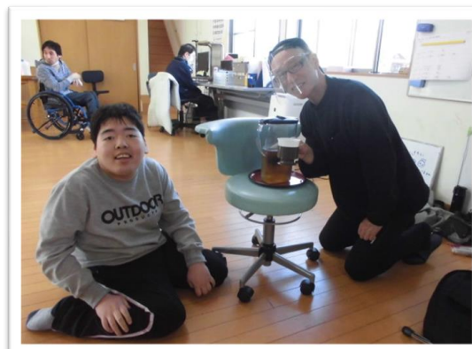
4/22(木)外部ボラ(遥研命様)