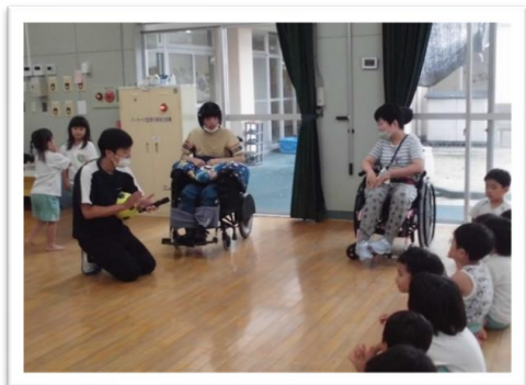
7/6(火)ミュージックケア(上木戸こども園)