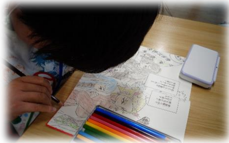
それぞれが思いおみの時間を過ごされています

ショートステイふれんどでは、自宅で介護を行っている方が様々な理由により介護を行うことができない場合、一時的に施設に入所していただき、食事、排泄等の必要な支援を行います。このサービスは介護者にとってのレスパイト（休息）としての役割も担っています。ゆったりとした室内でご自分の時間を大切にしたい方も利用しやすいように完全個室と利用に不安がある方も安心して利用が出来る多床室があります。利用される際にご相談ください。