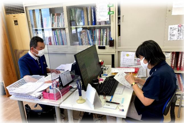
私たち二人が皆様をお待ちしております