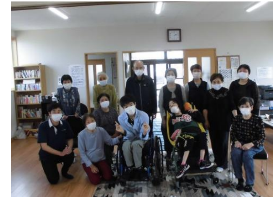
ミュージックケアによる地域交流

今回は、5月26日に実施した地域啓発委員会の逢谷内自治会館でミュージックケアの活動を紹介します。自治会の皆さんと一緒に音楽に合わせて体を動かしました。