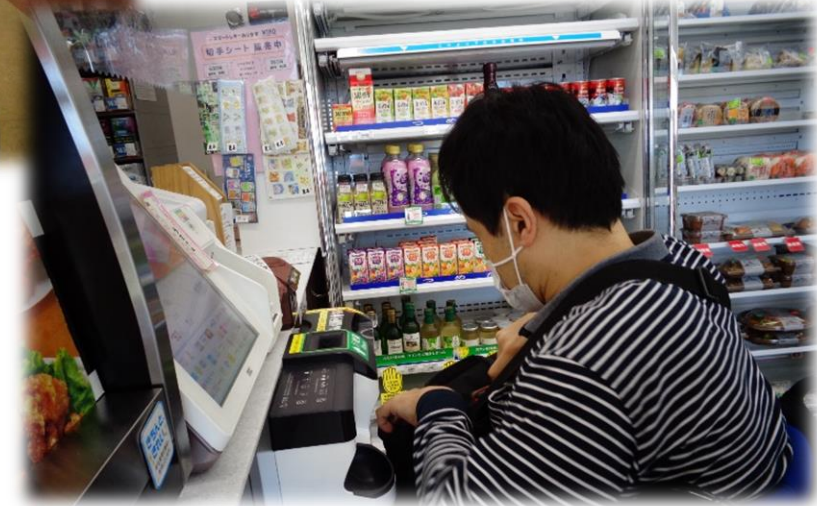
コンビニでのお買い物