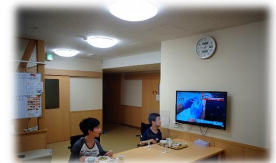
コロナ対策をしておきの夕食タイム