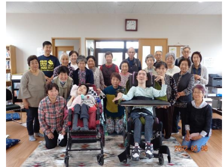
6月 逢谷内会館へ遊びに行ってきました。なんと100歳を超える方もいらして…元氣なシルバー世代の方々です。