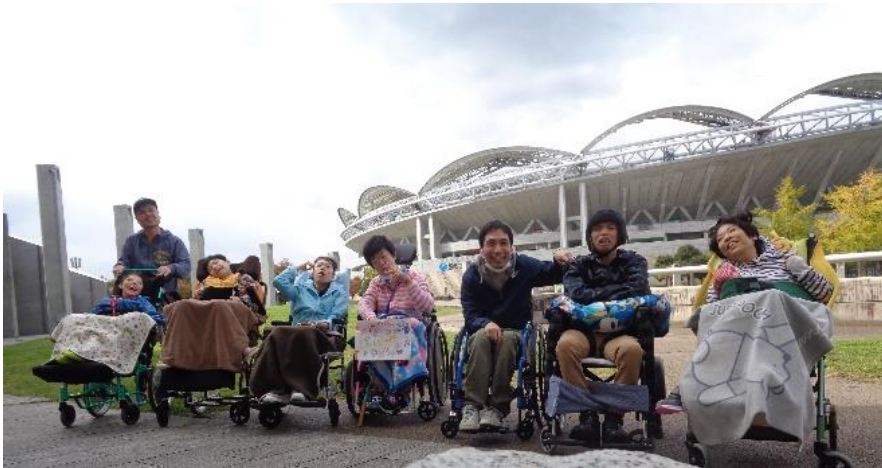
9月 ビッグスワンへ行って来ました！観覧席に入る瞬間その大きさに皆さんテンションアップ！