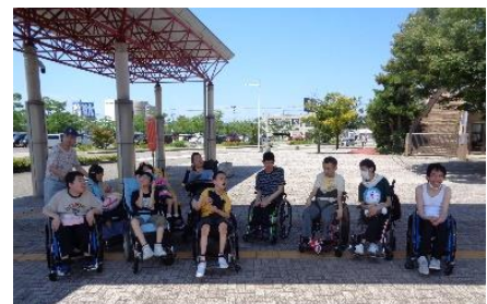
8月 暑い日でしたが東スポ訪問。ミストが気持ち良いんです。