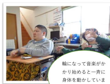
11/25(金)ミュージックケアレク