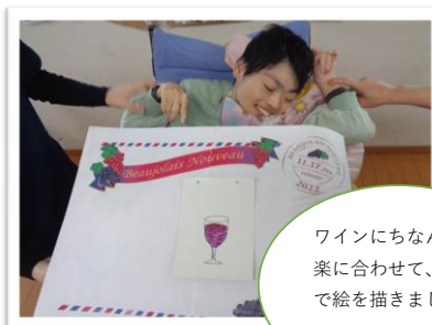
11/17(木)ボージョレヌーボーの日レク