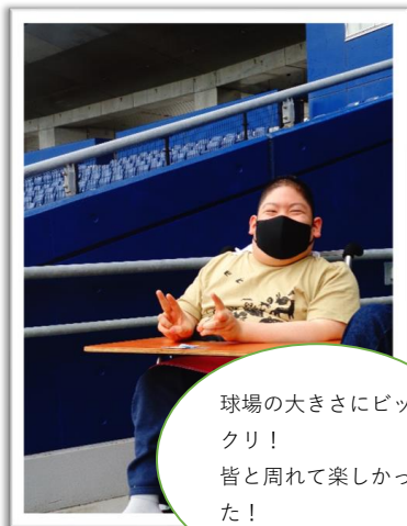
6/9(金) 外出行事(エコスタジアム)