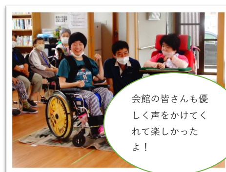
6/14(水) 地域交流(逢谷内会館)